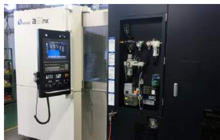
横軸マシニングセンター