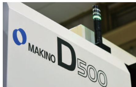
5軸マシニングセンター